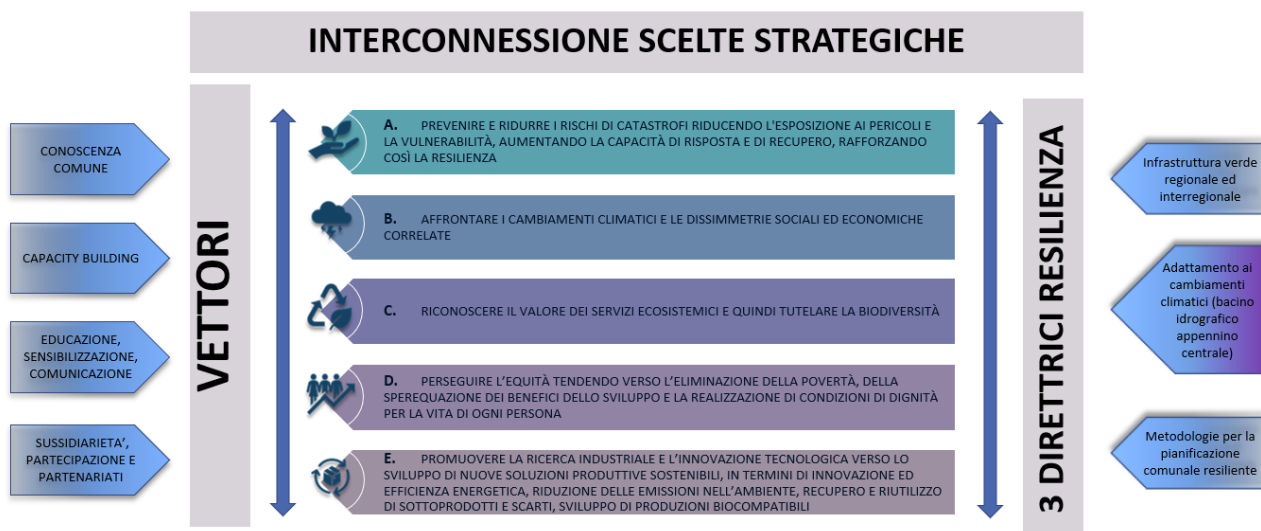
Figura. Struttura della Strategia Regionale per lo Sviluppo Sostenibile.

Al fine di evidenziare le interconnessioni fra la SRSvS e il programma regionale di governo 2020-2025, si riporta di seguito il raccordo fra: