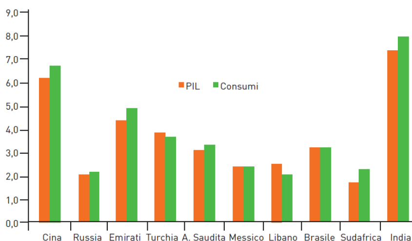
Grafico 2.1 - PIL e consumi nei principali mercati emergenti Var. %; media annua 2018-2023

I paesi emergenti rappresenteranno sicuramente un'opportunità per le nostre produzioni di qualità – la crescita attesa è prossima al 40% -, i prodotti cosiddetti BBF (Belli e Ben Fatti), quei prodotti dell'alimentare moda e arredo in grado di veicolare un valore aggiunto distintivo del Paese Italia ottenendone in cambio un prezzo più alto almeno del 20% rispetto ai concorrenti mondiali 20 .