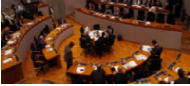
Via libera alla manovra di assestamento del Bilancio