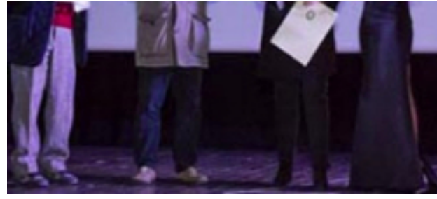
Il Consiglio regionale sostiene la campagna benefica Telethon